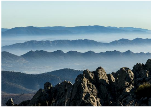
Relieve Apalachense en Las Villuercas (Cáceres)