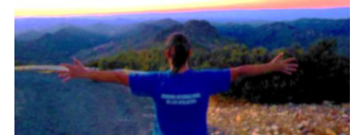
Relieve Apalachense en Las Villuercas (Cáceres)

Enlace con los Volcanes Apalachenses de las Tierras de Calatrava