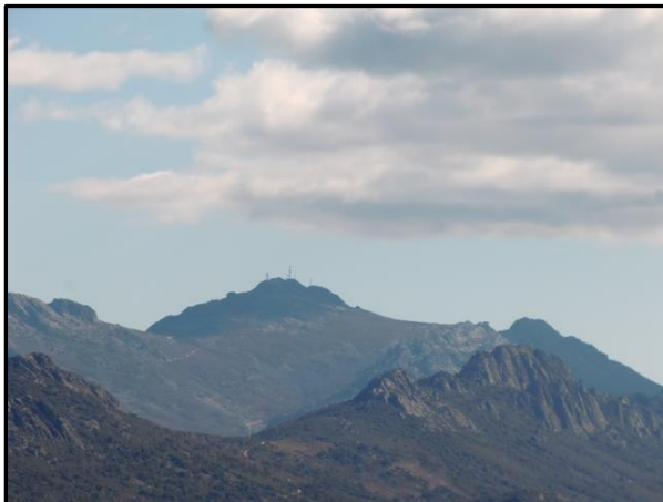
Risco La Villuerca

Las Villuercas se encuentran entre el río Tajo y el Guadiana, al sureste de la provincia de Cáceres en Extremadura. La comarca la conforman, las Villuercas, los Ibores y la Jara.