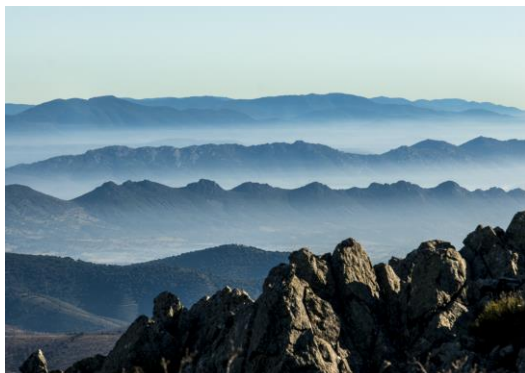
Relieve Apalachense en Las Villuercas (Cáceres)