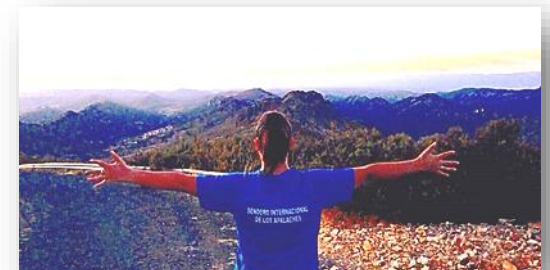
Relieve Apalachense en Las Villuercas (Cáceres)