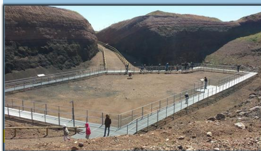
Volcán Museo de Cerro Gordo (Granátula de Calatrava)