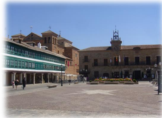
Plaza de Almagro (Ciudad Real)

A través de todo el recorrido del Sendero Internacional de los Apalaches por las Tierras de Calatrava , recorreremos pueblos llenos de encanto, historia y cultura que no nos dejarán indiferentes.