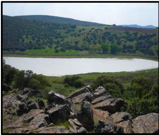
Maar o Laguna cráterica