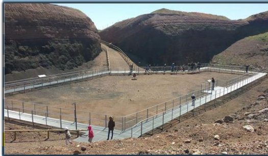
Volcán Museo de Cerro Gordo (Granátula de Calatrava)